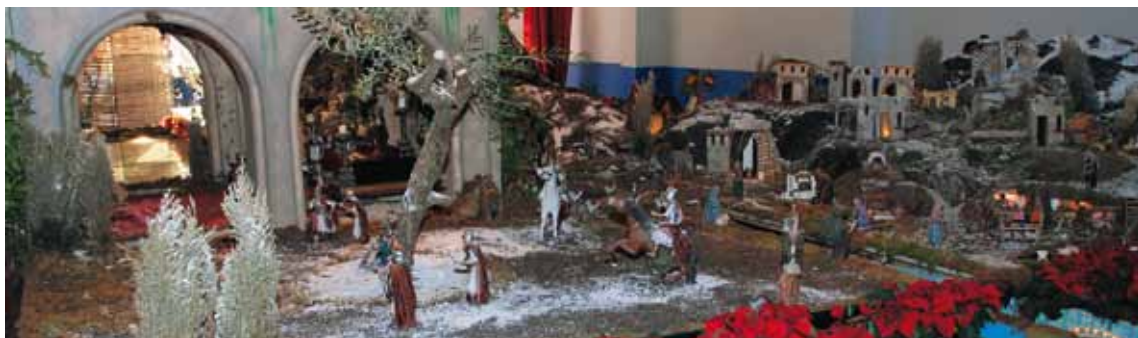
BETLEM DEL LLAVANER. DESEMBRE'10-GENER'11