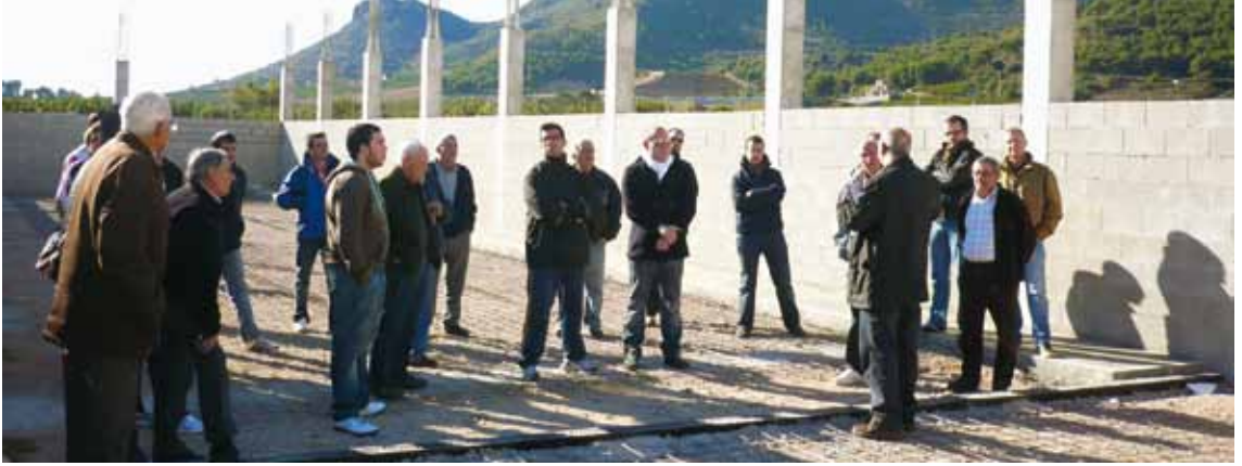
VISITA A LES OBRES DEL CARRER DE LA PILOTA PEL MÓN DE LA PILOTA. 5 DE DESEMBRE