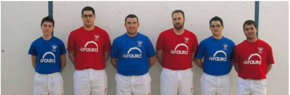
UN ANY MÉS FAURA ACOLLIRÀ LES FINALS DE CATEGORIES ESCOLARS DEL TROFEU EL CORTE INGLÉS AL NOU CARRER DE PILOTA. A LA FOTO, ELS EQUIPS DE JUVENILS I DE MAJORS PARTICIPANTS