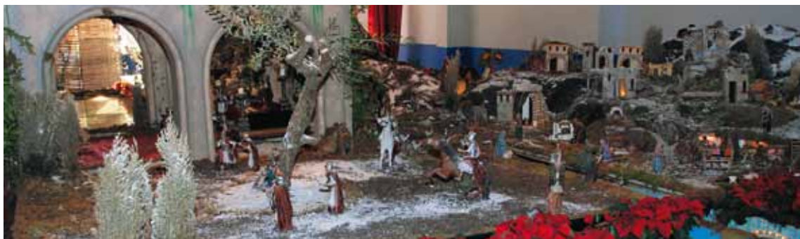
BETLEM DEL LLAVANER. DESEMBRE'10-GENER'11