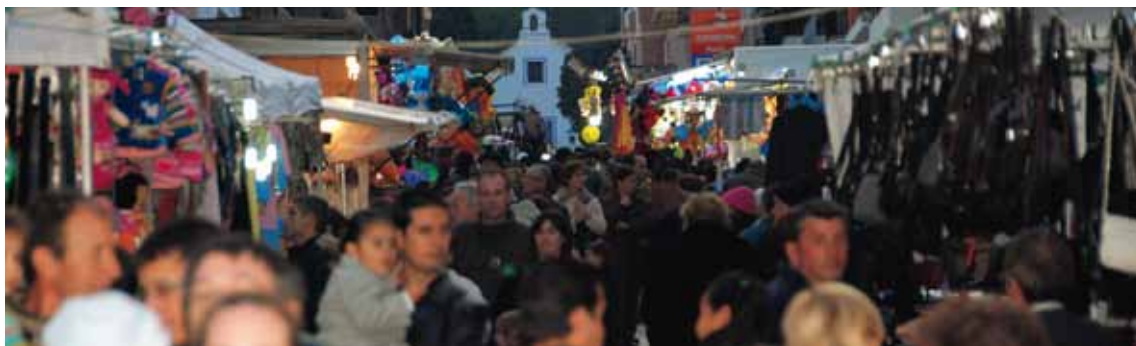
FIRA DE FAURA. DIA 5 DESEMBRE