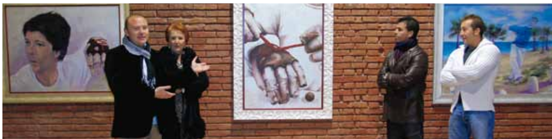
EXPOSICIÓ DE CARI CAUDET SOBRE EL MÓN DE LA PILOTA. DESEMBRE'10-GENER'11