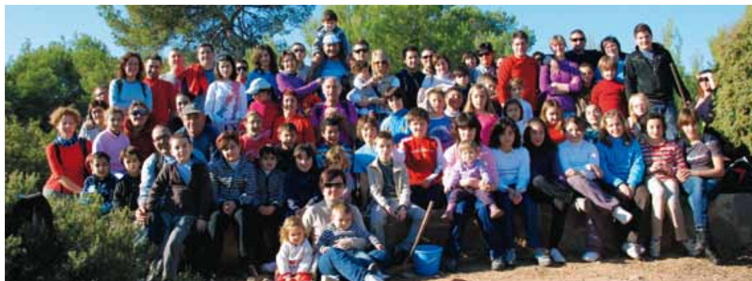
DIA DE L'ARBRE. 6 DE FEBRER.