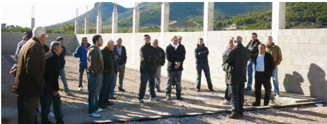
VISITA A LES OBRES DEL CARRER DE LA PILOTA PEL MÓN DE LA PILOTA. 5 DE DESEMBRE