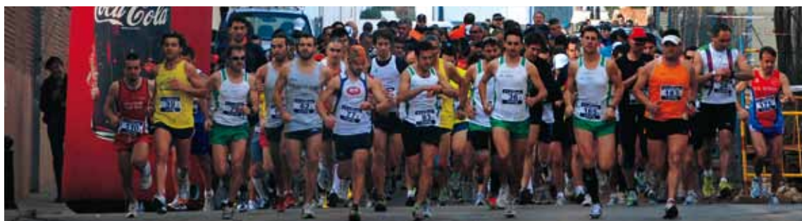
MITJA MARATÓ. 12 DE DESEMBRE