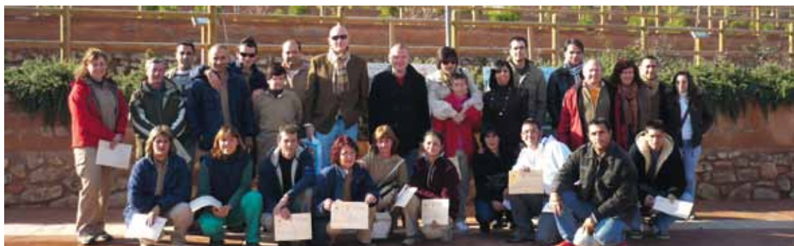
CLOENDA TALLER D'OCUPACIÓ DE JARDINERIA I VIVERISME. 20 DE DESEMBRE