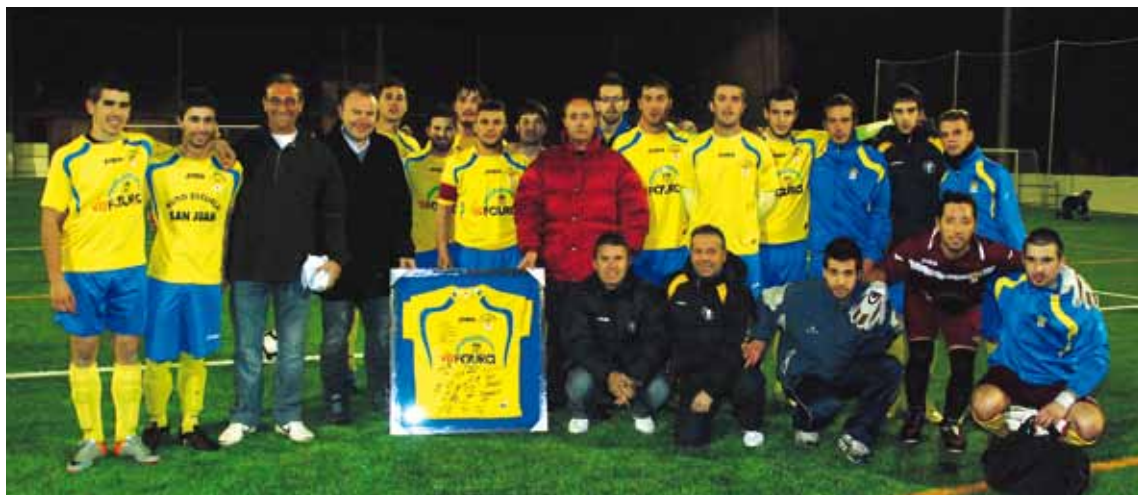
OBSEQUI D'UNA SAMARRETA SIGNADA PELS JUGADORS DE PRIMERA EL DIA DEL PRIMER PARTIT. 26 DE GENER