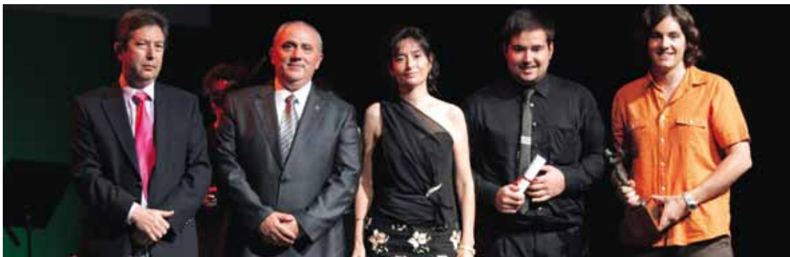
LA SJMF REP EL PREMI EUTERPE A LA PARTICIPACIÓ FEDERAL. 18 DE SETEMBRE