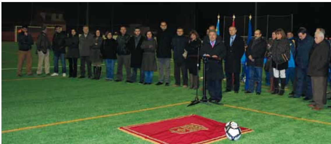
RECEPCIÓ DE LES OBRES DEL CAMP DE FUTBOL I VISITA DEL PRESIDENT DE LA DIPUTACIÓ PROVINCIAL DE VALÈNCIA. 25 DE GENER