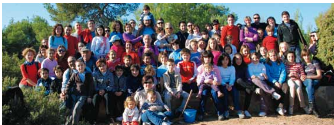
DIA DE L'ARBRE. 6 DE FEBRER.