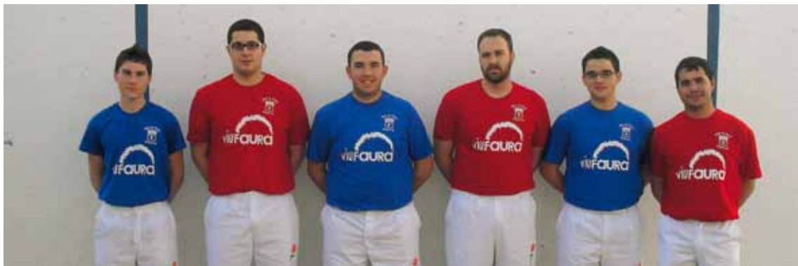
UN ANY MÉS FAURA ACOLLIRÀ LES FINALS DE CATEGORIES ESCOLARS DEL TROFEU EL CORTE INGLÉS AL NOU CARRER DE PILOTA. A LA FOTO, ELS EQUIPS DE JUVENILS I DE MAJORS PARTICIPANTS