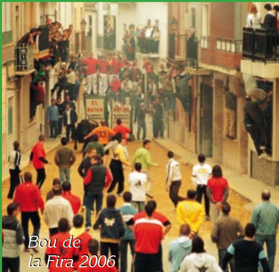
Bou de la Fira 2006