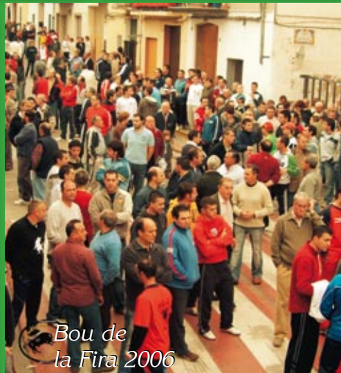
Bou de la Fira 2006