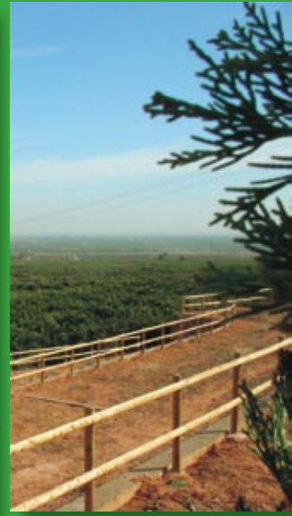
Continua creixent el Parc de la Rodana. Desembre 2006