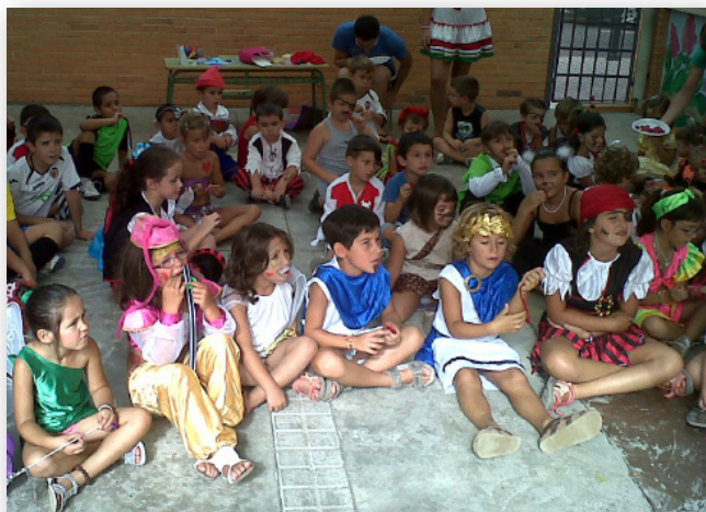
Del 2 al 27 de juliol. Xiquets i xiquetes a l'escola d'estiu.