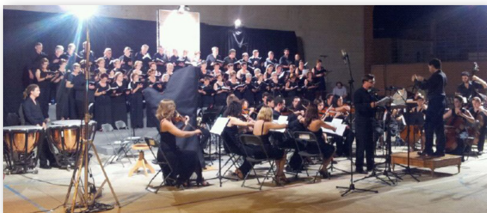
4 d'agost. Actuació de l'orquestra Ensemble Col legno al Vé Cicle de Música Vicent Garcés