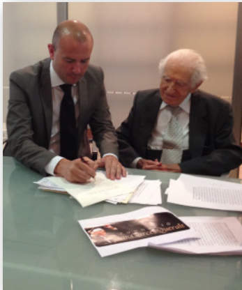
25 de juny. Firma de la Fundació "Joan Garcés Queralt"